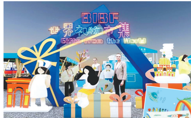
第二十九届北京国际图书博览会特色展区——世界礼物市集和BIBF绘本展。

在其他专业活动方面，本届图博会将围绕“全球网络出版发展趋势”“童书出版高质量发展”“跨国出版公司的出版发展”等主题，举办网络出版发展论坛、2023出版与技术创新大会、世界童书论坛、首届出版学科与教育国际高峰论坛等活动，为出版上下游搭建跨国界、跨时空、跨文明的出版交流合作公共平台，深入探讨出版业在未来的多种可能，进一步深化合作内涵，提升出版国际合作成果转化率。