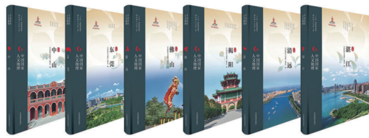
《中国国家人文地理》

该图集填补了我国极高山地图的空白,对于促进国际冰川研究的学术交流、服务寒区科学研究、推动极高山区生命科学研究和冰雪水资源开发利用、促进特种旅游事业的发展等具有重要意义。