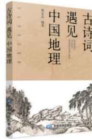
《古诗词遇见中国地理》

珠峰百科全书,见证中国精神与力量。认识地球从珠峰出发,一起探寻山水之极、生命之极、梦想之极。