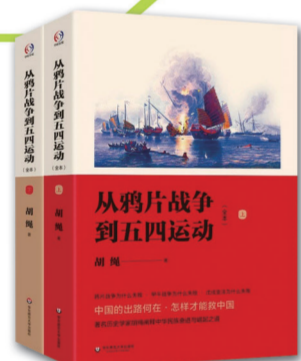
从鸦片战争到五四运动