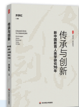
传承与创新: 新中国教育人类学研究70年

全国百佳图书出版单位 中国出版政府奖·先进出版单位 全国版权示范单位 上海市知识产权示范企业 上海市版权示范单位 上海文化企业十强