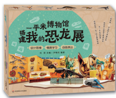
一平米博物馆:搭建我的恐龙展