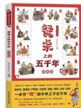
儿童中国简史:餐桌上的五千年