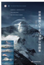
《世界海拔八千米以上雪山地图集》

“地理第一课”通过文字、图片、地图、插画、思维导图等形式将地形、地貌、历史、文化、民俗等地理知识串联。“历史第一课”结合中学课标、课本和中考考点,描述历史事件、历史人物、典章制度的来龙去脉。适合小学四至六年级和初中一、二年级学生阅读。