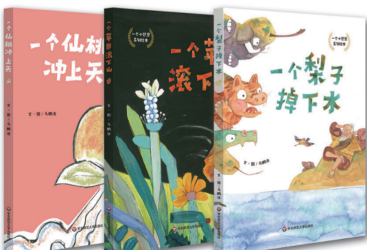
一个仙桃系列绘本(3册)