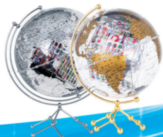
35CM中英文金(银)色 政区圆方透明地球仪

通过自然与生物、考古与历史、科技与生活、人文与地理、艺术与文明五大专题绘本,展示了多座规模宏大、珍品云集的世界知名博物馆,也有特色突出、颇具代表性且藏品精美的小型博物馆。