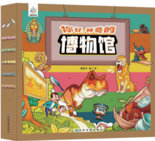
《你好,神奇的博物馆》

通过自然与生物、考古与历史、科技与生活、人文与地理、艺术与文明五大专题绘本,展示了多座规模宏大、珍品云集的世界知名博物馆,也有特色突出、颇具代表性且藏品精美的小型博物馆。