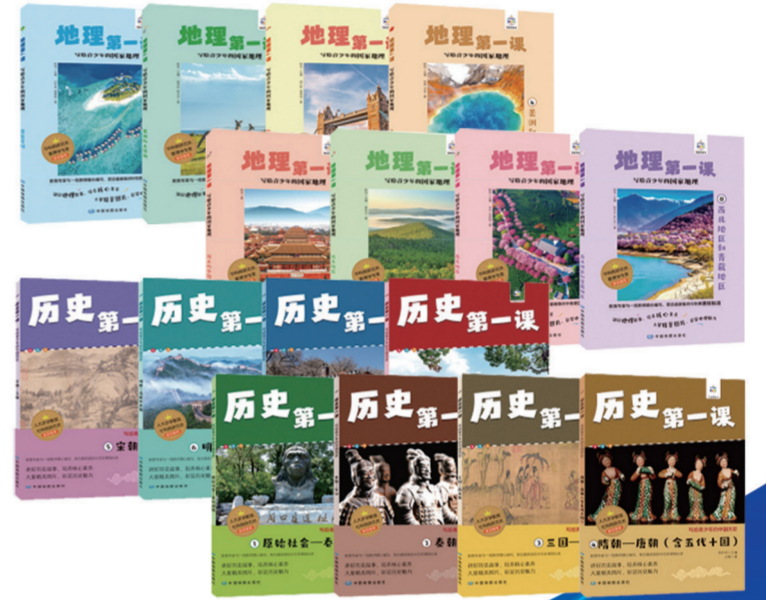
“地理第一课·写给青少年的国家地理”系列 “历史第一课·写给青少年的中国历史”系列

七大地理景观主题,精选百首诗词名篇;七幅精美手绘地图,精准定位诗词地点;地理视角现代解读,全面认知传统文学;图书+动画立体呈现,有趣的多元阅读体验。