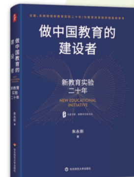
做中国教育的建设者 ——新教育实验二十年