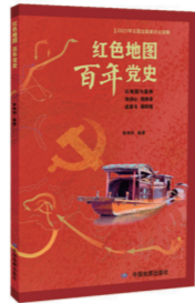
《红色地图百年党史》

由开天辟地、土地革命、全民抗战、解放战争、大业奠基、艰辛探索、伟大转折、世纪跨越、科学发展、奋进新时代共10个篇章组成,各篇章均以地图为主要表达载体,为读者再现了中国共产党团结带领全国各族人民为争取民族独立、人民解放和实现国家富强、人民幸福而不懈奋斗的100年。