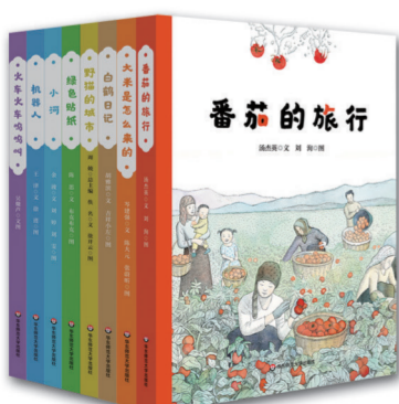
美慧树原创绘本(精装版,8册)