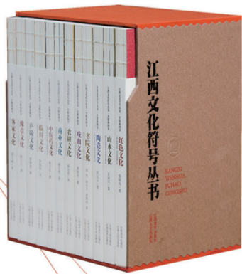
“江西文化符号丛书·第一辑”（中文版）

“文化是一个国家、一个民族的灵魂”，“江西文化符号丛书（第一辑、第二辑）”中文和英文版是由中共江西省委宣传部组织编撰、重点打造的一套向海内外读者讲好江西故事、传播好江西文化的精品读物，力图把江西优秀传统文化中的具有当代价值、世界意义的文化精髓向全世界读者展示，是“一带一路”倡议下的江西文化走出去普及读本。为更好地传播中国声音，江西美术出版社将于6月15日的第29届北京国际图书博览会期间举办“江西文化符号丛书”第一辑海外成果发布会暨第二辑版权推介会、多语种版权输出签约仪式，同时还将展出《艺术为人民——延安美术史》、“中国历史文化名人画传”、《木刻青年——新兴版画的开拓者》、《彩绘景德镇》、《画事：中国画的诗意世界》等众多弘扬中华优秀传统文化的精品图书。