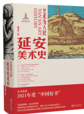
《艺术为人民——延安美术史》

本系列图书是朱虹先生等作者倾力打造的一套精品力作，在他们的笔下众多历史文化名人如雄州雾列、似俊星驰跃然于字里行间。丛书以图文并茂的形式、饱含温度的文字带领读者跨越千年，感悟历史积淀、传承中华文脉。