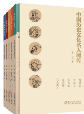
“中国历史文化名人画传”