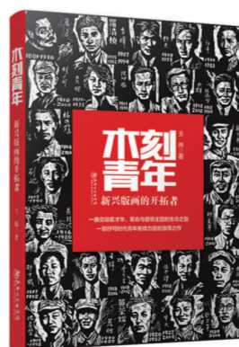
《木刻青年——新兴版画的开拓者》

本书对延安美术丰富的历史内涵、延安美术的体系性特征以及深刻的社会历史动因作了充分的挖掘和梳理，不仅是以延安为切入点，对中国革命文艺起源与发展的历史总结，更是不忘初心，对社会主义文艺的展望。