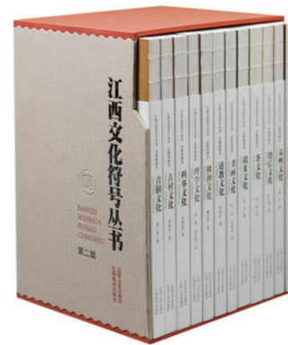
“江西文化符号丛书·第二辑”（中文版）