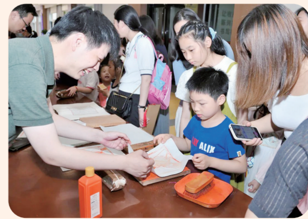
端午节前夕，扬州大学校工会与图书馆举办“典籍里的端午”沉浸式文化体验活动。广陵古籍刻印社雕版技术省级非遗传承人现场讲解雕版印刷流程，并带领孩子们进行印刷体验，绘制屈原像和古诗书签。