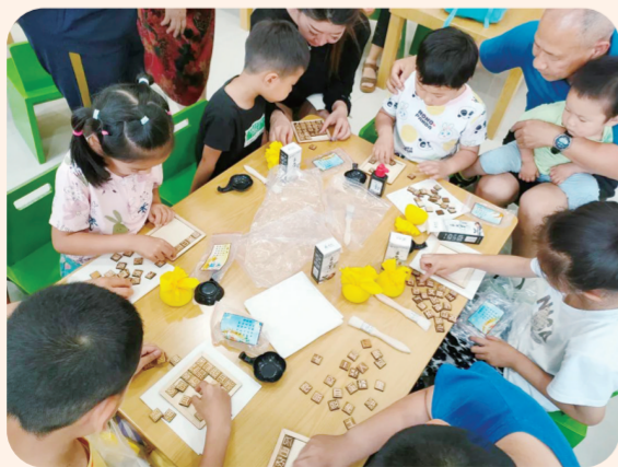
6月22日，山东省滨州市图书馆滨城馆举办“体验活字印刷 感受非遗魅力”传统文化活动，让孩子们在端午节与活字印刷相遇，共赴一场有意义的非遗之旅。