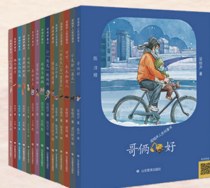
▲“梁晓声人间童书”系列(15册) 梁晓声 著