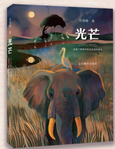
▲《光芒》 刘海栖 著