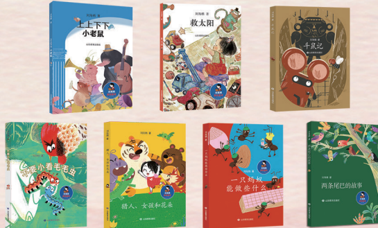
▲“刘海栖原创童话”系列 刘海栖 著