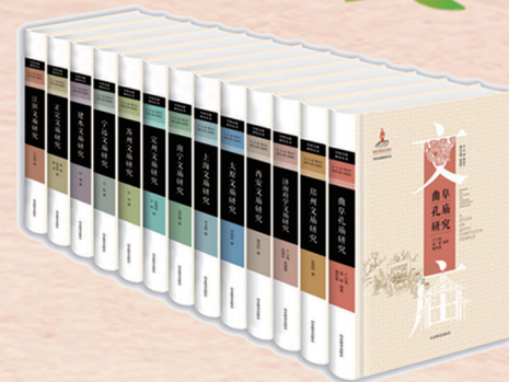
▲“中国文庙研究丛书”(13册) 总主编 周洪宇 副总主编 赵国权