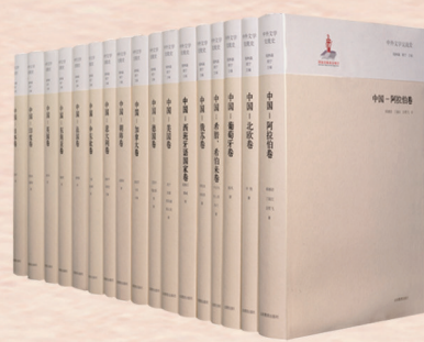
▲《中外文学交流史》(17卷) 钱林森 周宁 主编