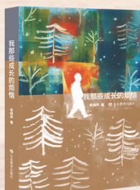
▲《我那些成长的烦恼》 梁晓声 著