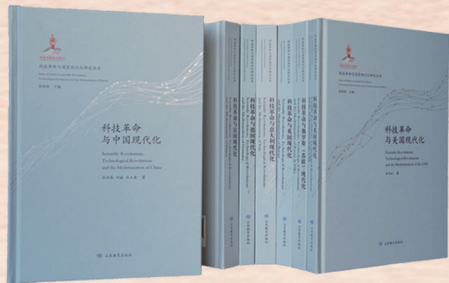
▲“科技革命与国家现代化研究丛书”(7卷) 张柏春 主编