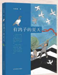
▲《有鸽子的夏天》 刘海栖 著