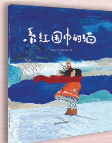
▲《系红围巾的猫》 米吉卡 文 猫屋Becky 绘