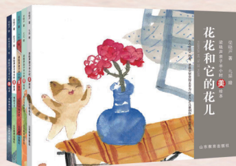
▲“梁晓声亲子半小时美绘本”系列(5册) 梁晓声 著