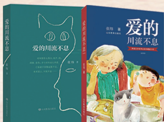
▲《爱的川流不息》(文字版、插画版) 张炜 著