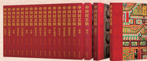
▲《中国民艺馆》(第一、二辑 共20册) 潘鲁生 主编