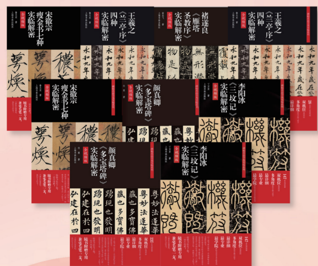
“碑帖名品全本全临”系列