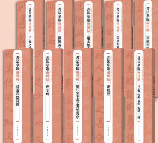
“书法摹临两用帖”（第一辑10种）