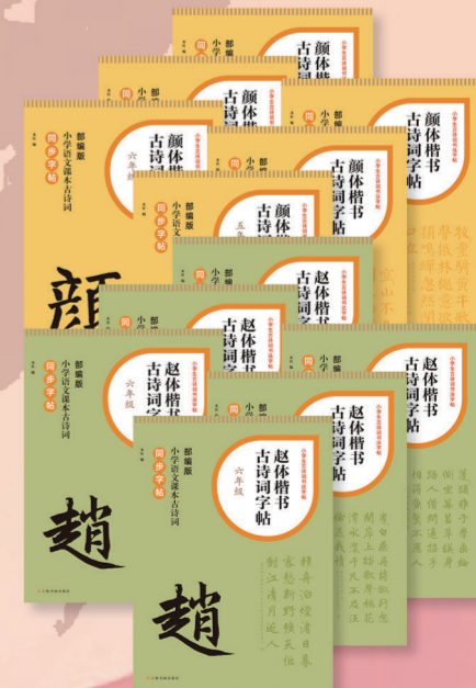
“小学生古诗词书法字帖”系列丛书