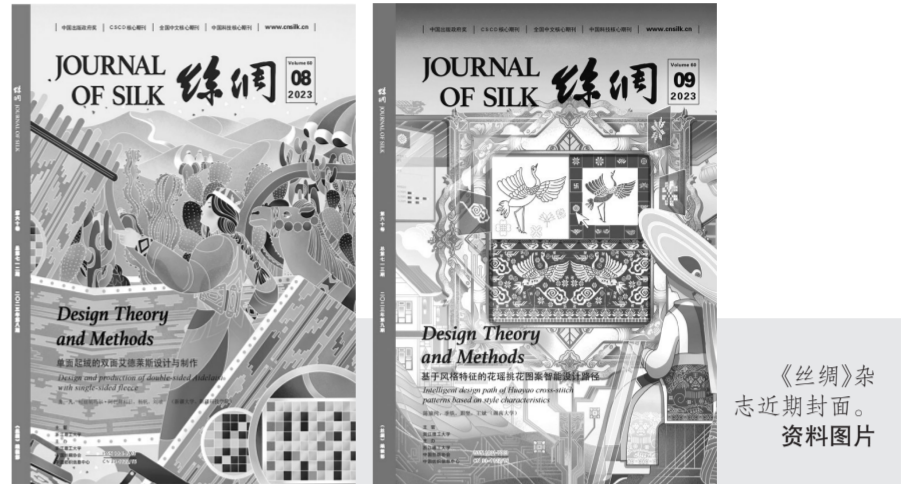
《丝绸》杂志近期封面。资料图片

2020年，《丝绸》用“一带一路”的主题，设计了12张精美的封面图，让一册册杂志成为美轮美奂的艺术品；2021年，《丝绸》根据“碳中和”及“循环回收利用”的设计理念，邀请知名设计师创作了12幅以“可持续发展”为年度主题的艺术设计作品用于期刊封面；2022年，《丝绸》用“主题叙事”的方式，选择了南宋著名画作《耕织图》中的12幅“织”图，按照古代丝绸生产制作技艺流程，绘制成艺术插画，