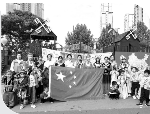
▲郑州市中原区桐柏路街道平安街社区联合金城幼儿园组织开展“迎国庆”“56个民族”庆生“护苗”活动。