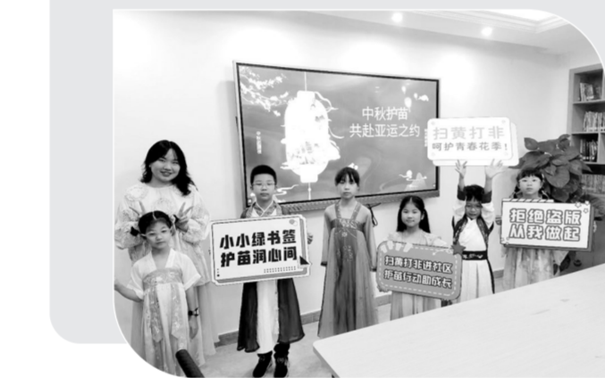
▲浙江省杭州市上城区彭埠街道将手工制作和“护苗”宣传相融合,举办“中秋护苗共赴亚运之约”活动。