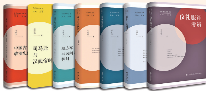
“台湾地区国学丛书”

立足专业优势，九州出版社涉台研究著作均由涉台研究领域著名、知名专家学者撰写，获得两岸学界的充分肯定。如《中国台湾问题》等系列读本，包括干部读本、外事人员读本、简明读本、党校读本、大学生读本等版本，覆盖范围广泛。2015年编写出版的《中国台湾问题干部读本》（修