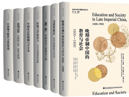
“海外中国专题研究丛书”

订版)及其配套资料，获得第六届中华优秀出版物奖图书提名奖，为唯一入选的涉台类图书。“民进党研究丛书”“‘台独’研究丛书”入选“十五”“十一五”国家重点出版物出版规划项目；《清代台湾军事与社会》入选“十二五”国家重点出版物出版规划项目；《自决权理论与公民投票》等入选“十二五”国家重点出版物出版规划项目；《台湾民意与群体认同》入选“十二五”国家重点出版物出版规划项目；《两岸冠冕同宗同名聚落》等重点规划图书入选“十三五”国家重点出版物出版规划项目。“民进党研究丛书”“‘台独’研究丛书”开研究领域之先河，受到两岸专家及台湾政界人士的高度重视，很快在台湾出版了繁体版；《台湾历史纲要》《清代台湾移民与社会研究》等还被台湾大专院校指定为教材；《自决权理论与公民投票》先后荣获胡绳青年学术奖和教育出版成果奖；《冷战后美日欧盟与台湾关系研究》则获得了中共中央党校科技成果奖。