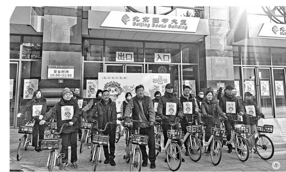
图① 11月10日上午,一场骑行仪式在北京图书大厦门前举行,以“书香至味”为主题的2023北京发行集团“书馨节”正式开启。

本报讯 (记者李婧璇)11月10日上午,一场骑行仪式在北京图书大厦门前举行,以“书香至味”为主题的2023北京发行集团“书馨节”正式开启。 据介绍,11月10日至26日,“书馨节”举办期间,北京发行集团组织北京图书大厦、王府井书店、中关村图书大厦、亚运村图书大厦四大书城和中国书店、北京市新华书店特色门店(10家)形成联动,汇集来自全国上百家重量级优质出版单位出版的超10万种精品图书,为广大读者奉上一场墨香四溢的文化盛宴。 书城、书店结合自身特色差异化设立“书香至味”主题展区。其中,“真理的味道”主题展区集中陈列党政、主题出版类图书,“传统的味道”主题展区展示中华优秀传统文化类图书、古籍图书以及京味图书。“健康的味道”“科学的味道”“人生的味道”“成长的味道”“艺术的味道”“家乡的味道”等主题展区也汇聚、展示各门类精品图书。 “书馨节”齐聚行业大咖、名人名家,为作者与爱书人搭建了一个面对面沟通交流、阅读分享的平台。各参与书城、书店将结合自身优势,线下推出阅读互动、阅读推广等活动近130场,线上直播等活动近30场,彰显一店一特色,为读者开启一场可读、可逛、可买、可体验、可分享的沉浸式阅读文化之旅。 北京发行集团相关负责人表示:“‘书馨节’旨在搭建书店与读者、读者与读者之间的沟通、交流、分享之桥,激励、鼓舞并引导更多人走进书店参与阅读。”