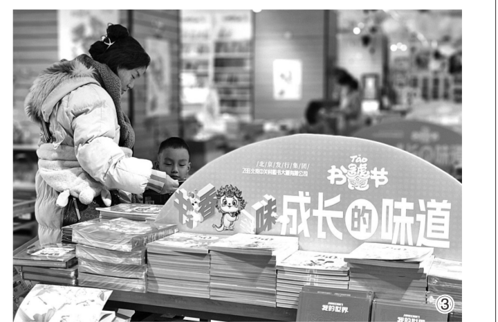
图③ 中关村图书大厦设立的“书香至味”主题展区。