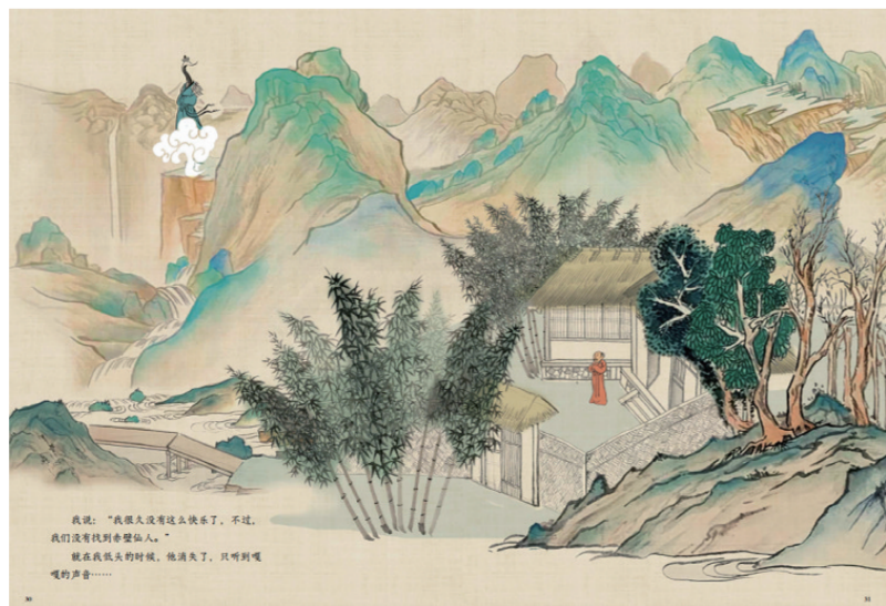
插图选自《名画里走出的中国故事》。

书中的10幅古画均为彩图，还有局部放大图和虚线注解，不仅可以看清图中的人物与物，还能近距离欣赏技法与意境。更难能可贵的是，还附赠了《洛神赋图》《步辇图》《十八学士图》3幅藏品的电子版，扫码便可欣赏高清长卷，放大欣赏画作细节。