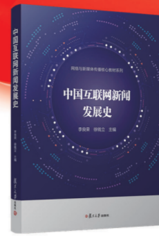
中国互联网新闻发展史 李良荣 徐钱立 主编