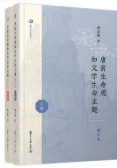
唐前生命观和文学生命主题（增订本） 钱志熙 著