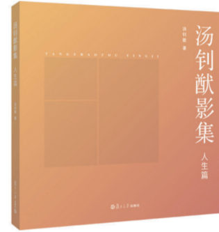
汤钊猷影集（人生篇） 汤钊猷 著