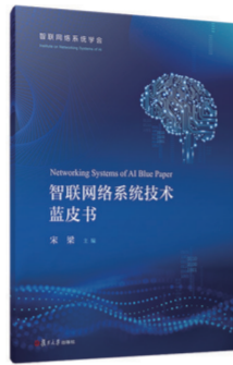
智联网络系统技术蓝皮书 宋梁 主编