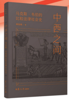
中西之间：马克斯·韦伯的 比较法律社会史 赖骏楠 著