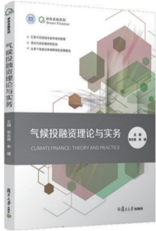
气候投融资理论与实务 李志青 李瑾 主编