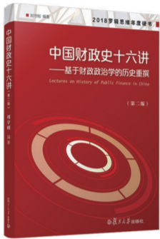
中国财政史十六讲——基于财政 政治学的历史重撰（第二版） 刘守刚 编著