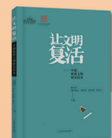
《让文明复活——中德纸质文物修复技术》

浙江科学技术出版社 定价:78.00元 这是一部以小切口反映大时代、大主题的探索之作,是向新中国第一代建设者致敬的礼赞之歌。本书以两位老耄老人跨越大半个世纪的感人故事为切入点,通过对上世纪50年代大学生夫妇相携一生的奋斗历程和家国之梦,折射出新中国第一代建设者的时代背影。本书旨在向老一辈建设者致敬,启迪当代年轻人感悟人生价值,为民族复兴注入强大动力。