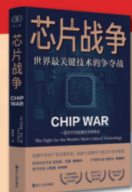
《芯片战争:世界最关键技术的争夺战》

浙江教育出版社 定价:78.00元 本书深入贯彻落实习近平总书记“传承发展中华优秀传统文化”“培育和创造新时代中国特色社会主义文化”的时代要求,着眼于唐宋八大家的诗文,以新颖的角度选篇,以史实为基础,兼顾历史性、思想性、欣赏性、可读性,让读者通过愉快的阅读,触抵韩愈、柳宗元、欧阳修、苏洵、苏轼、苏辙、王安石、曾巩的灵魂,体味文墨风采,领略唐宋风韵,把握中国古代文化发展脉络,进而坚定文化自信,赓续文化根脉。