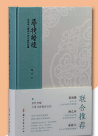
《寻找缙续:白居易(缙续)诗与唐代丝绸》

浙江少年儿童出版社 定价:52.00元 临近大年夜,爱美又骄傲的小舞狮换上了新装。它出门游玩的过程中,遇到迷路的小羊动物们,于是带着它们一起找家。找家的过程充满波折,鸟儿遇到鸟群、兔子遇到兔群、蝙蝠遇到蝙蝠群,却不是它们的家人。除夕之夜,狮子决定带着心情低落的动物们回到自己的村庄一起过年。村里灯火通明,窗户外贴着各式吉祥窗花,动物们突然齐齐找到了家。原来它们都是剪纸动物,藏在狮子的毛发中跑出来玩,却忘了回家的路。 作品运用手工木刻画版的方式,融合传统剪纸元素与现代设计元素,营造出温暖又热闹的氛围。画面同时蕴藏着对故事线索的暗示与幽默的细节,展现动物的天性、动物之间的趣味互动。