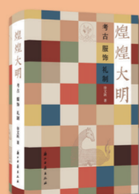
《煌煌大明——考古、服饰、礼制》

浙江古籍出版社 定价:168.00元 《寻找缙续:白居易(缙续)诗与唐代丝绸》从白居易诗出发,结合唐代现存至今的丝绸图像及工艺图解,从唐代丝绸种类、规格、纹样、色彩、材料等方面,全面深度解读唐代丝绸工艺盛况。 本书披露了作者依据文献、文物资料梳理考证,发现陕西法门寺地宫发掘的一件浴袍就是存世唯一使用了唐代缙续这一过程,是唐代文学、考古、历史、科技、艺术、经济和生活的又一次综合研究成果。