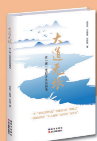
《大道无限:在“浙”里打开共富画卷》

浙江古籍出版社 定价:188.00元 《煌煌大明》的副标题是三个关键词,分别为“考古”“服饰”“礼制”。其中,“考古”是方法,“服饰”是核心,“礼制”是本质。作者充分利用考古材料,并与传世文献、图像相互佐证,呈现明代不同阶层的冠帽服饰。 本书不仅有助于深入研究这个时期的社会、文化和历史,还拓展了我们对历史的认知,有助于保护和传承这一重要时期的文化遗产。本书的护封来自于一块明代纳谏,可以有不同的解读,护封的背面是明代服饰图样,非常精美。本书图片多达183张,四色印刷,适合对古代服饰感兴趣的读者,对于专业读者来说也有借鉴意义。