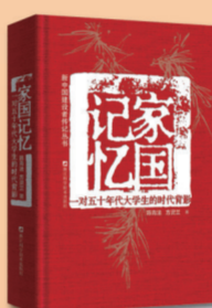
《家国记忆——一对五十年代大学生的时代背影》

浙江人民美术出版社 定价:9800.00元 全集共分八册,收录国家图书馆自前身京师图书馆建馆以来所藏的金文拓片3000余件。国家图书馆是国内外收藏金文拓片最多的公藏单位,所藏皆重器精拓。本套全集是对国家图书馆所藏金文的首次全体系整理与出版,经辨伪去重后,先以器形分类,并开创性地按照年代排列,详细著录原拓的尺寸、来源、款识、题跋等内容,以及器物的年代、国别、现藏地等信息,并附有反映古文字学界最新研究成果的释文。全书具有金文齐备、器形齐全、拓本精良、孤本较多、版本丰富、递藏有序、藏家著名、拓工知名等特点。