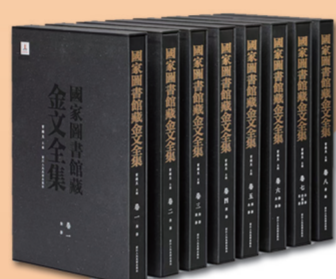
《国家图书馆藏金文全集》

浙江人民美术出版社 定价:698.00元 《西厢双阙》辑录明末戏曲版画中两套堪称绝美的名品,凌瀛初刻朱墨套印《千秋绝艳图》以及闵齐伋刻彩色套印《会真图》。为还原古籍的精美趣味,此次出版将二者原大影印,全本再现,展现中国古代版画艺术的绚烂成果。 随书另附董捷教授关于《西厢记》版画的最新研究著作《鸳鸯三叠:明代版画中的〈西厢记〉》,以《西厢记》女主人公鸳鸯为线索,拈出“遇艳”“窥简”“长亭”三段小文,共同组成图文并茂的《鸳鸯三叠》。他以一位生动叙述者的姿态,从图像与史料中挖掘出历史的丰富景观,将琐碎的历史细节连缀成一幕幕鲜活的明清生活图景,实乃图、文两绝之佳作。