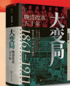
《大变局:晚清改革五十年》

浙江人民出版社 定价:88.00元 经济历史学家克里斯·米勒在书中较为完整地描述了各国为控制芯片技术而进行的长达数十年的斗争历程,解释了半导体在现代生活中主导地位,并将这种技术应用于军事系统的。本书集科技冒险、商战故事、大国博弈于一体,分析了芯片崛起的历史,以及以控制芯片行业未来为目的的日益复杂的地缘政治权力斗争,对理解当今的政治、经济和科技至关重要。