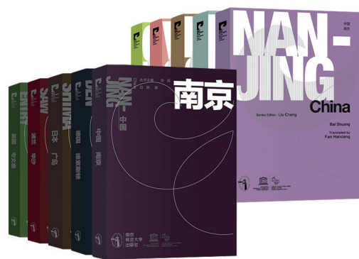
《国际和平城市丛书》 刘成 主编

《中国文化植物经典读丛书》是一部思想性、科学性和艺术性有机统一的中华优秀传统文化通俗读本，由花卉文学与文化研究专家程杰教授领衔撰著并主编。丛书精选牡丹、梅、松、竹、兰、荷、菊、杨柳、桃、杏等10种对中华民族具有重大历史文化意义，并深具民族传统特色和经典符号象征意义的文化植物。 丛书涵容诸如自然资源与园艺栽培、经济活动与社会风气、文艺创作与艺术活动、人物故事与文化掌故等各领域成果之经典，以选注并品介典籍文献、名篇佳作、警言名句的方式，全面系统地展示了10种文化植物五彩缤纷的历史景观、丰富复杂的思想体系、深厚博大的精神意义以及鲜明而灿烂的民族特色。