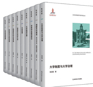
《当代高等教育研究新视野丛书》 编委会 编

这套原创中华文化绘本是第十一届南京图书馆陶风图书奖少儿类获奖图书，共8册，书名分别是《奶奶的麦芽糖》《姥姥的红烧肉》《软软的黏黏的》《包子一家》《我喜欢包饺子》《甜甜芦排排队》《我不是薯条 我是春卷》《小面团变身》。 该套绘本从幼儿的角度出发，选取了幼儿常见的几种美食，把食物的形、色、味跟生动、有趣的“排队”“变形”“旅行”这些幼儿感兴趣的话题结合起来，展现食物的丰富多彩、神奇、可爱、美妙。生动有趣的故事，形象可爱的绘画，不仅能增加幼儿对传统食物的了解，激发幼儿对食物的兴趣，也能拉近幼儿与传统文化的距离，让幼儿在生活中感受传统美食、品尝中国味道。