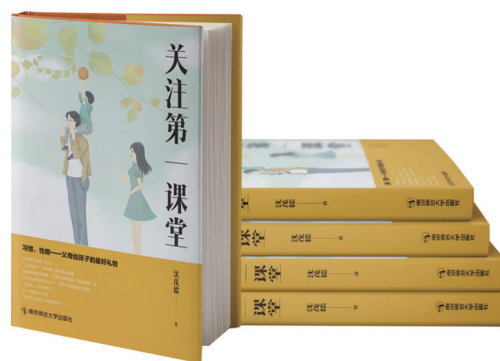
《关注第一课堂》 沈茂德 著

《国际和平城市丛书》（第1辑10册），遴选5座拥有二战记忆之城——中国南京、德国德累斯顿、日本广岛、波兰华沙、英国考文垂，以和平视角，跨历史、政治、社会、心理学等领域，呈现战前、战中和战后的城市文化与历史变迁。这5座城市承载了二战不同阵营的战争记忆，见证了战争带来的重创和悲怆。如何面对战争遗产？如何构建和平发展之路？伴随对这些共性问题的思考与实践，5座城市形成了各具特色的战后发展路径。 丛书由国际学者联手打造，以中英文双版本呈现，史料翔实，图片珍稀，分析鞭辟入里，观点客观鲜明；由知名书装团队设计，精心编排，美观悦目；由上海雅昌双色印刷，成品雅致。