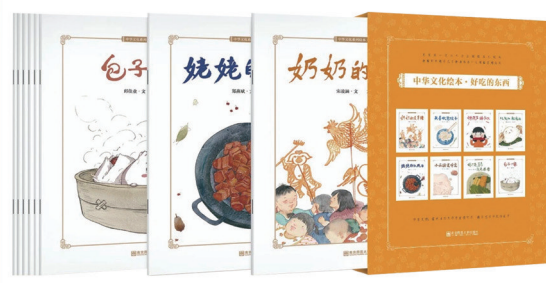
《中华文化绘本·好吃的东西》 郑磊 主编/姚虹 美术主编

“活教育”是陈鹤琴先生留给后人的宝贵财富。在“活教育”理论中成长起来的鼓动人，不仅自身成了“活教师”的代表，也在不断地进行着班级“活管理”、儿童“活发展”的全方位探索。今年是南京市鼓楼幼儿园建园100周年，我们为大家带来这套《幼儿园班级管理丛书》，一起探寻百年名园的管理经验与妙招。 本套丛书共6个分册，包含260个“基于儿童”真实生动的案例。通过故事叙述的形式，讲述了一日活动、教育活动、环境创设、游戏指导、家园合作、安全保障与健康这6个方面的幼儿园班级管理案例。无论是经验丰富的幼教管理者，还是热爱学习的一线教师，或是正在接受职前教育的学生，都能从中得到启发和借鉴。