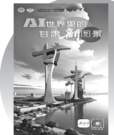
“新甘肃”（客户端）2024年甘肃两会作品充满科技感。

与此同时，甘肃国际传播中心拍摄并发布的《Louis看两会 探寻全过程人民民主的“密码”》6集系列短视频，通过直播镜头、代表委员讲述的方式，用镜头反映人民当家作主的真实图景和以人民为中心的价值理念，展现了中国民主的真实性和广泛