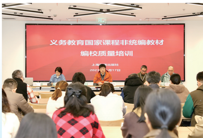
举行教材编校质量培训。