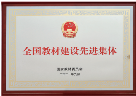
▲荣获“全国教材建设先进集体”。 ▲首屆全國教育出版教材獎評獎新刊。