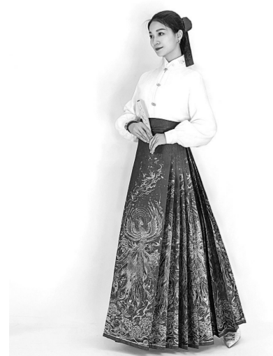
山东省菏泽市曹县汉服产品。

“强化组织协调，要素保障，经验推广，努力打造民间文艺版权保护与促进高地，为全国民间文艺版权保护与促进提供菏泽经验。”菏泽市民间文艺版权保护与促进试点工作动员会上的要求，为解决问题提出了方案，也为产业高质量发展吹响了集结号。