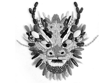
韩国瑞创作的东明粮画作品《龙行龘龘 五谷丰登》。

“菏泽民间文艺在发展过程中逐步形成了汉服、木雕、柳编、工笔牡丹画、鲁锦、粮画等较为完善的民间艺术产业集群。”提起菏泽民间文艺特色项目，山东省菏泽市文化和旅游局相关科室负责人向《中国新闻出版广电报》记者如是说。