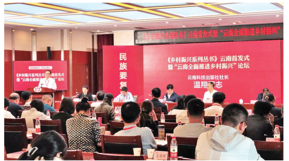
“乡村振兴系列丛书”首发式。

科技阅读与科技发展相适应,可以重塑对未来科技的想象。当务之急是动员和组织科技、教育、科普、出版等方面的专家,共同研究科技阅读的产品供给,策划、创作、出版一大批高质量的科技读物,包括符合各个年龄段的科技阅读的产品,如绘本、图书,也可以是专业课程、科普视频等。要加强基层调研,明确市场需求,创新形式,精心策划,以高质量的科技阅读产品满足公众的个性化需求。通过专家推荐、优秀评选、作品欣赏等形式,借助阅读节、科技周、科普日等重要活动,加大对科技阅读优秀作品的推荐宣传,组织科技阅读征文比赛、宣讲、演示等,扩大社会影响,引导科技阅读不断走向深入,为全民阅读增添一抹科技的亮色。