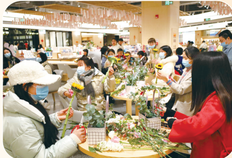
读者在南昌书城书店体验花艺沙龙。

今年,江西新华将在品牌文化活动策划上提质发力,推进“护苗·绿书签”“新华大讲堂”“新华优选”“新华共读”等系列文化活动,全年将组织开展2000多场文化活动,增加文化活动供给,让人们参与阅读、爱上阅读、推广阅读,促阅读变“悦读”,不断掀起全社会读书热潮。