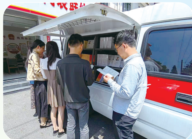
流动售书车开进乡村街道。