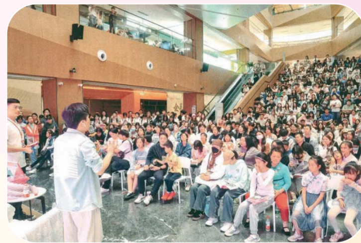
南昌书城举办文化活动。

力保障各党政机关、学校、部队、企事业单位和广大干部群众能够第一时间进行学习。为了给广大党员干部群众的学习和购买提供良好的条件,依托新华书店覆盖全省的发行网络体系,通宵作业,争分夺秒,连续奋战,第一时间组织物流配送,为全省各基层新华书店征订发行提供有力保障,充分满足了广大党员干部群众学习阅读需求,在全省营造了浓厚的学习教育氛围。