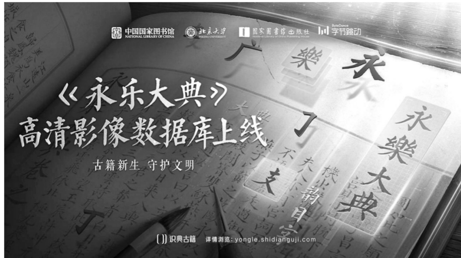
《永乐大典》高清图像数据库在“识典古籍”数字化平台的上线预告。

化平台通过算法，给原本缺少断句的古籍自动打上标点符号。此外，为了进一步提升文字识别的精准度，命名实体识别技术会通过预测文字的实体标签，识别包括人名、地名、书籍、时间、官职在内的5种类型的专有名词。