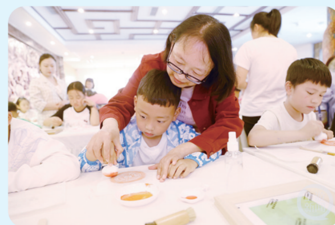
重庆市民族博物馆开展“5·18”国际博物馆日文物拓印研学体验活动,近百名家长和学童参加。