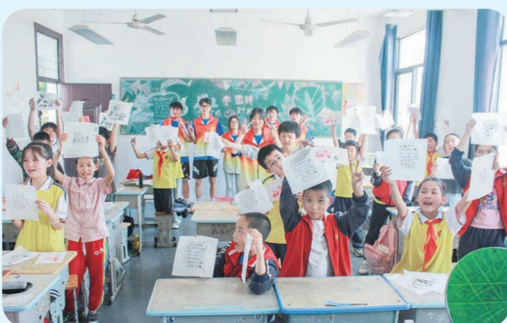
湖北武汉信息传播职业技术学院印刷文化馆老师走进江夏法泗街法泗小学,用一堂探秘印刷术的文博课,让小学生们零距离触摸非遗文化。