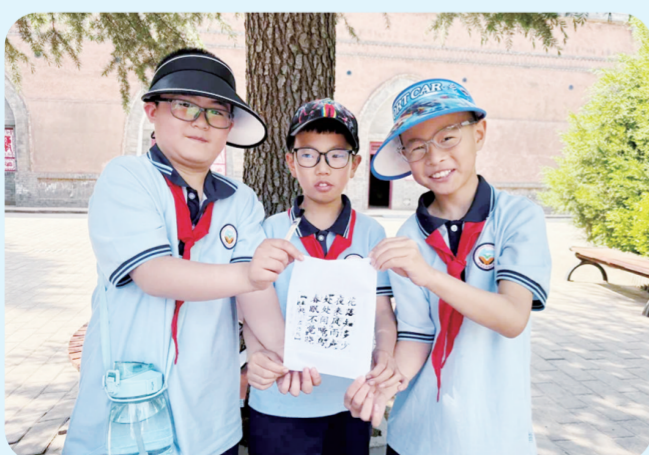
甘肃省庆阳市西峰区博物馆举行“中华之美·文字之魂”活字印刷术体验活动,通过理论讲解和实践操作相结合的方式,带领同学们体验活字印刷的魅力。