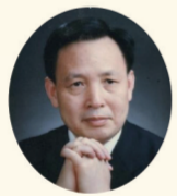
何星光 中国社会科学院学部委员、一级教授，国务院参事

实现中华民族伟大复兴中国梦的奋斗目标，离不开强大的思想保证和精神动力。只有把铸牢中华民族共同体意识作为党的民族工作和民族地区各项工作的主线，才能增强中华民族共同体的精神力量，才能把中华民族共同体打造成交融一体的有机整体，才能为中华民族复兴和全面建设社会主义现代化国家提供强大的精神力量。