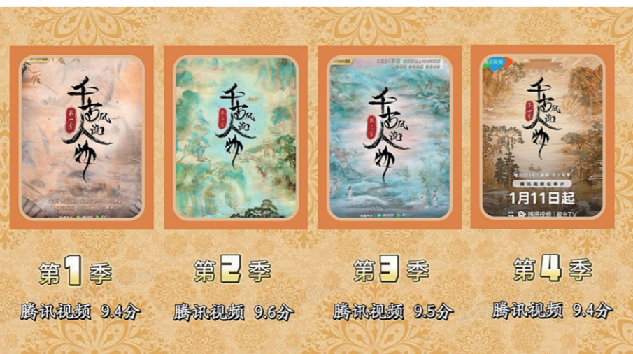
《千古风流人物》腾讯视频评分