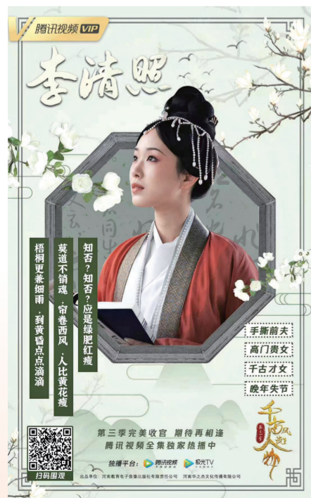
《千古风流人物》人物海报