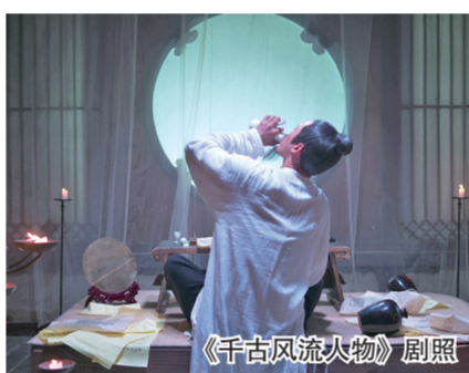
《千古风流人物》剧照

《千古风流人物》系列纪录片每集25分钟，聚焦具有代表性的中国古代文化名人，一至四季讲述李白、李商隐、辛弃疾、柳永、杜甫、曹植、杜牧、白居易、李煜、陆游、陶渊明、李清照、欧阳修、苏轼、李贺、刘禹锡、柳宗元、孟浩然、王勃、王维共20位诗词文人的大人生故事和艺术成就。该片通过情景再现、动画和特效等手法，全景式立体化呈现这些人物的故事，以及他们对中国乃至世界文化的影响，为观众提供了一个深入了解中国历史文化的窗口。