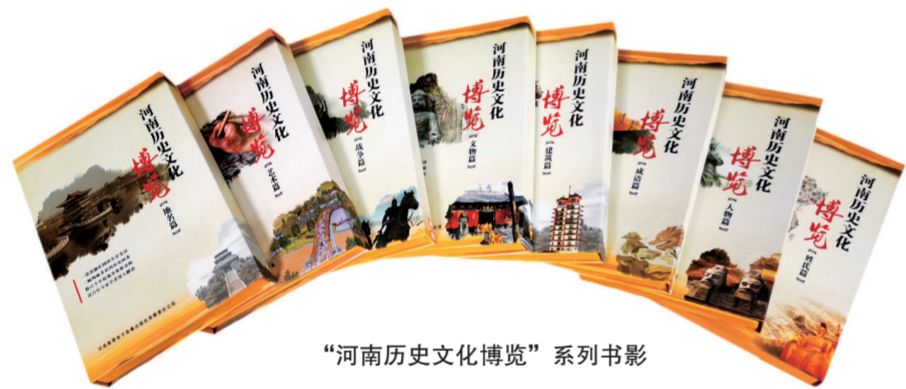
“河南历史文化博览”系列书影

纪录片不仅关注这些文化名人的个人传记，还深入探讨了他们的古诗词作品，结合历史背景和专家解读，全面而深入地展现了这些人物的生活和情感世界。在影片中，李白以理想浪漫的生活方式创作了众多佳作，但内心也有对自由和功业的渴望；杜甫经历过求仕失败、家庭思念和疾病折磨等，但他的作品深刻反映了人世的艰辛。这些我们耳熟能详的历史人物，通过纪录片的镜头生动、立体起来，呈现出鲜明的不同特点。