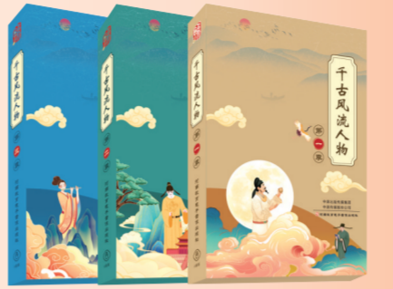
《千古风流人物》书影

诗歌是中华优秀传统文化的瑰宝。河南教育电子音像出版社历时4年、走访40座城市、采访30余位专家，拍摄制作了大型历史文化类纪录片《千古风流人物》。这部作品是有效推动中华优秀传统文化创造性转化和创新性发展的生动实践和优秀成果。