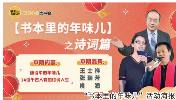
“书本里的年味儿”活动海报

小角度也能反映大主题，小故事也能讲出大道理。在《千古风流人物》系列纪录片播出的同时，河南教育电子音像出版社结合时代特点传承创新，将诗词文化历史的厚重悠长与当代发展的时尚活力有机融合，通过新媒体宣传渠道和线下活动，多向发力，强化传播力和影响力。