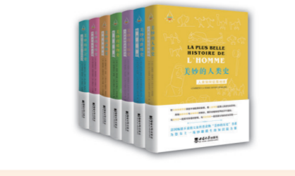
“美妙的历史”书系 本套丛书采用科学记者和各领域权威专家对话的形式讲述历史,探讨前沿话题。书中对话轻松愉悦,内容“干货”满满,看似严肃的学术内容,实则饱含诗意与激情;由浅入深的讲解,似乎把记忆唤回了课堂,让知识的获取成为一种享受。