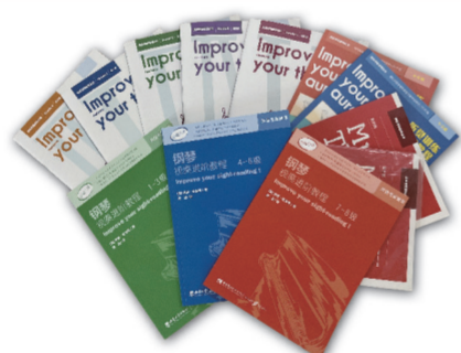
“英皇考级辅导”丛书 本套丛书获得英国菲伯尔音乐图书出版公司(Faber Music)独家授权出版,是英国皇家音乐学院联合考试委员会音乐考试(ABRSM)权威辅导用书,是涵盖视奏、音阶、乐理、听觉等多个门类的训练教程。