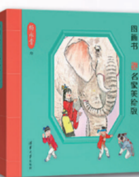
中国儿童传统故事图画书 名家彩绘版 第一辑 The Illustrated Edition of Traditional Chinese Children's Stories: Volume 1 (by Renowned Artists) 作者:杨永青 ISBN: 9787302648574 定价: 150.00元