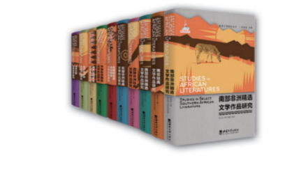
“非洲文学研究丛书” 我国首套系统、完整、客观科学、有中国特色的“非洲文学研究丛书”,代表了我国对非洲文学研究的国家水平,具有较高思想价值、学术价值、文化价值;具有全局性、战略性、前瞻性,呈现了我国哲学社会科学领域的重大实践创新成果。