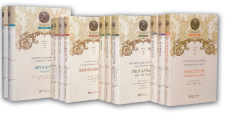
“俄罗斯音乐”译丛 2021年入选中国十大音乐类翻译丛书。“俄罗斯音乐译丛”涵盖音乐家传记、音乐文献史料、作曲技术理论、音乐美学与批评等门类,被中国西方音乐学会会长杨燕迪先生誉为“汉语语境下西方音乐研究的知识生产的重要驱动力”。