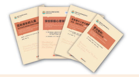
“儿童青少年心理健康与教育”译丛 本套丛书以立足中国国情,学习借鉴国际教育成果,促进我国儿童青少年心理健康及教育事业发展服务为目的。该丛书遴选书目遵循科学性、权威性、实用性原则,打造出内容丰富、理论扎实的科普篇章,为未来培养更多更优的高素质、创造性人才服务。