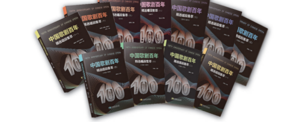
《中国歌剧百年—精选唱段集萃》 本丛书是国内收录曲目最全、时间跨度最大的歌剧教材,共12卷,收录了117部歌剧中的366首唱段,其中绝大部分唱段以五线谱记谱,并附有钢琴伴奏谱和文字注释。整套曲集从中国歌剧源头寻起,将零散的歌剧作品进行统整,在诸多优秀剧作中提炼精选唱段,既便于查阅,又能够直观而清晰地了解作品的年代归属与时代特性。本丛书为“中华民族音乐传承出版工程精品出版项目”。