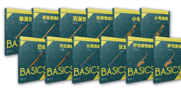
Basics 乐器基础学习丛书 《音乐周报》2023年度十大音乐图书(排名第一)。“Basics乐器基础学习丛书”是在西洋乐器的基础教学中全方位融入了中国传统音乐元素,旨在通过器乐演奏的相关学习和活动,激发学习者了解和熟悉中华民族经典作品。该丛书已经实现图书版权输出,并至欧洲发行。