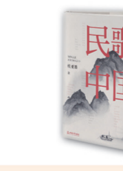
《民歌中国》 本书作者以旅行者的目光,分地域介绍了我国23个省、5个自治区、4个直辖市、2个特别行政区和56个民族的民歌特色及传播地域,并从调式色彩、曲式结构及演唱形式等方面对各个民族与地区的典型民歌加以分析,阐述各地民歌艺术特征。