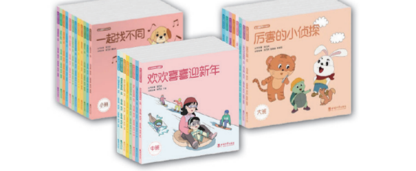
“幼儿园数学文化绘本”丛书 根据《幼儿园教育指导纲要(试行)》和《3—6岁儿童学习与发展指南》编写,专门针对3—6岁儿童,通过形象化的表达、好玩的故事把看不见、摸不着的数学具体化,让小朋友建立数学认知,培养数学思维,更重要的是培养数学兴趣。通过阅读,小朋友可以从故事中发现数学的乐趣,探索数学世界的奥秘。