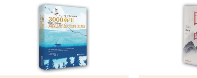
《3000英里阿拉斯加荒野之旅》 作家马克·亚当斯追随100多年前前哈里斯曼科考团队的足迹重新踏上探险之旅,为读者展现阿拉斯加因过度开发、捕猎、全球气候变暖发生的变化,以文学的笔触托承、融合了历史和地理知识,抒发了对荒野、对自然的热爱和敬畏之情。