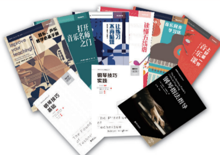
“提高你的音乐教学能力”丛书 《音乐周报》2022年度十大音乐图书。本套丛书原版从英国菲伯尔音乐图书出版公司(Faber Music)、美国印第安纳大学出版社等国外知名出版公司引进,力图为中国音乐教师带来全新的音乐教学理念、教学方法、教学体验与参考。