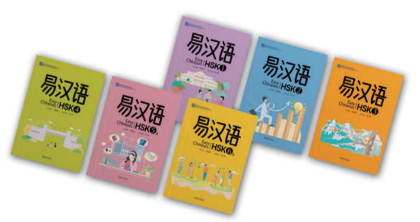
《HSK易汉语》智慧教材 《HSK易汉语》教材根据《HSK考试大纲》和俄罗斯、哈萨克斯坦、泰国等国家学生的思维方式、文化习俗、母语特征设计话题与语言任务,并尽量贴合当地学习者对汉语的关注点和兴趣点,加入当地学生常见的语言生活话题与场景。