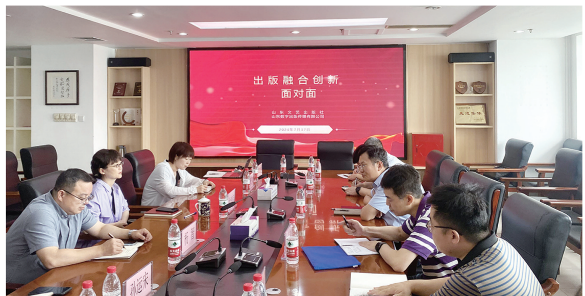
出版融合创新面对面活动激发融合出版新动能。