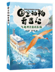
《国宝动物奇遇记:飞越那片海的朱鹮》