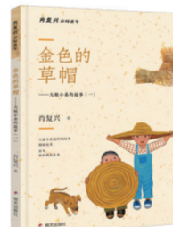
《金色的草帽——大姐小弟的故事(一)》