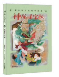
《神龙寻宝队:大秦兵马俑》