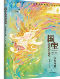
《国宝奇幻归家记:归兔万里》