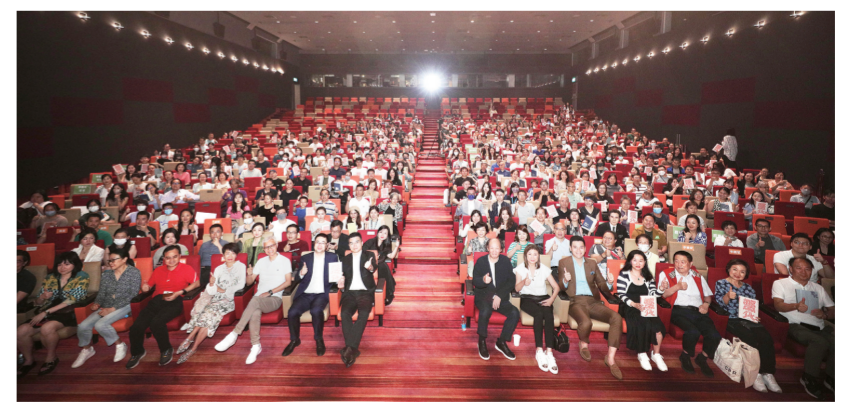
今年香港书展期间，邀请茅盾文学奖得主金宇澄访港，举办名家讲座“金宇澄：左手写作，右手画画”，逾600人出席，逾8万人观看线上直播。图为讲座现场大合照。

界展示并推荐中国“最美的书”以及以外文讲述中国故事的代表性书籍，呈现东方文化气息。展馆运用AI辅助设计，借助AR、VR、MR等数字技术将中华文化元素空间叠加于现实世界，加上中华非遗手工坊，营造独特的虚实融合体验，以数字科技之力推动中华文化全球传播。