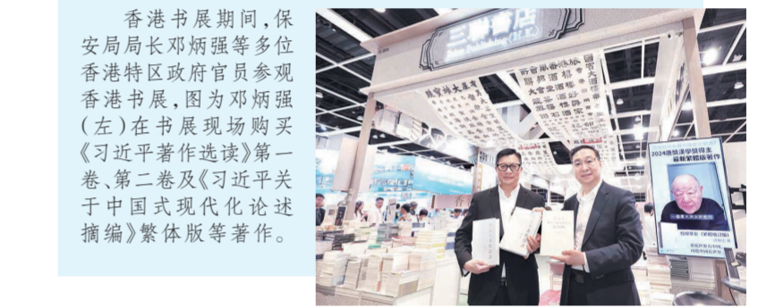
香港书展期间，保安局局长邓炳强等多位香港特区政府官员参观香港书展，图为邓炳强(左)在书展现场购买《习近平著作选读》第一卷、第二卷及《习近平关于中国式现代化论述摘编》繁体版等著作。