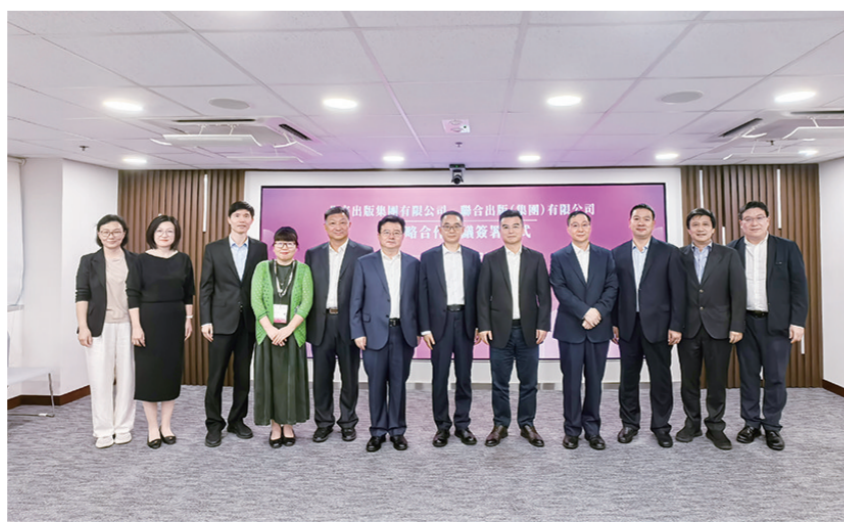
书展期间，联合出版集团与北京出版集团、中国新闻出版传媒集团等多个内地出版传媒集团签订战略合作协议，图为联合出版集团与北京出版集团签约仪式。