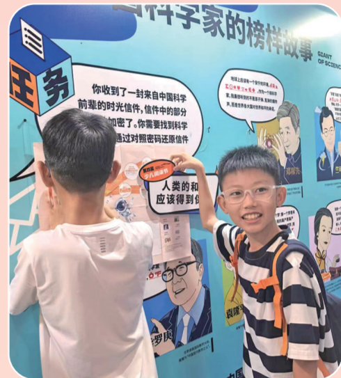
小读者在少儿阅读节区域玩闯关游戏。