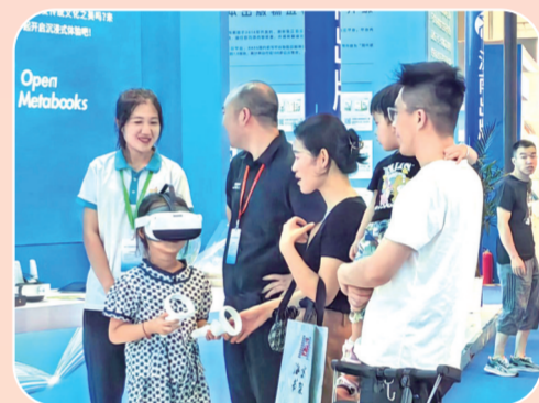
小读者借助可穿戴智能设备走进3D虚拟世界，打开阅读新“视”界。