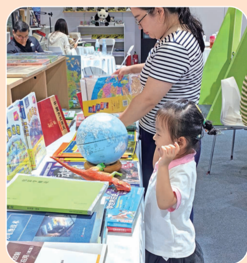
展区里的地球仪让小读者非常开心。