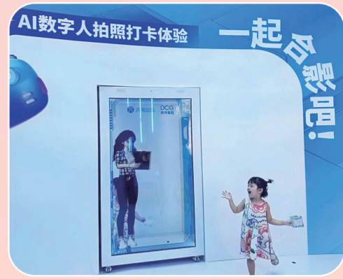
小读者高兴地与AI数字人互动。