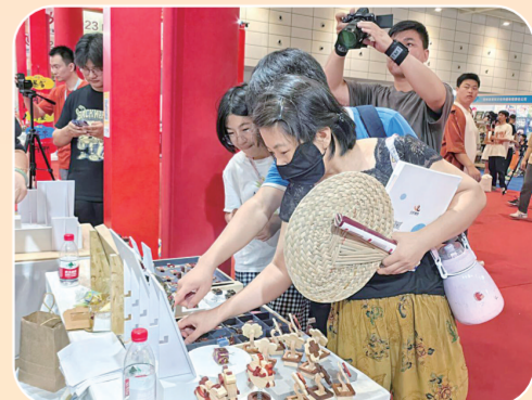
展会上的印章积木吸引参展者。