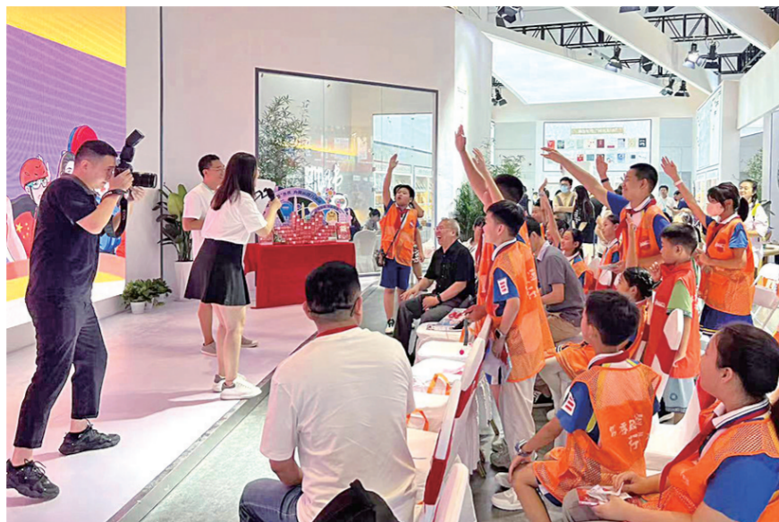
在“中国骄傲”新书推介会上，“小记者”踊跃提问。

书，更是内心满满的感动，仿佛怀揣着打开智慧之门的钥匙，又仿佛结交了一位新的朋友！”