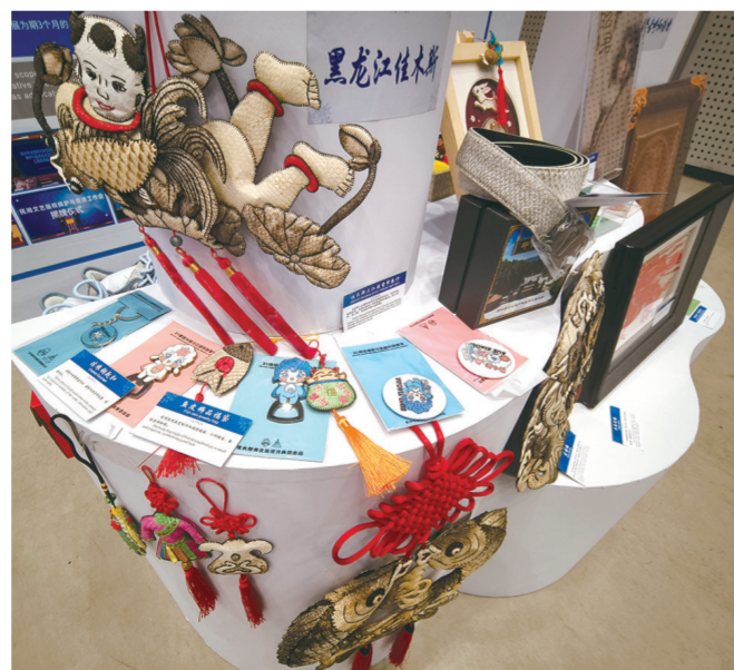
黑龙江佳木斯民间文艺作品。

民间文艺作品承载着多姿多彩的中华文化，依托版权的开发、运用，更多有创意的民间文艺作品正在走向世界。（下转02版）