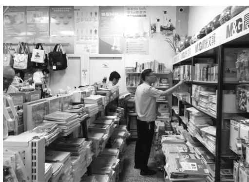
东至县将“保护知识产权、打击侵权盗版”作为文化市场整治重点，加大对侵权盗版案件的查处力度，维护版权市场秩序。

除了加大版权保护和执法力度，东至县还十分注重挖掘和发展具有地方特色的文化产业。结合乡村的独特文化，当地鼓励民间文艺工作者积极参与作品登记，这不仅有助于他们传承和发扬民间艺术，还能激发更多创意作品的产生。这些原创作品经过专业的包装和推广后，将成为促进乡村经济发展的有力动力，同时也为乡村振兴战略的实施提供了新的版权支撑点。