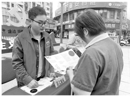
东至县文旅局联合县市场监督管理局、县人民检察院在汇金广场开展知识产权普法宣传活动。

在信息高速发达的时代，版权保护对于维护创作者的合法权益、促进文化产业的健康发展具有不可替代的作用。近期，安徽省东至县东流镇城东村迎来了一座崭新的文化地标——“扫黄打非”宣教公园。这座集版权宣传教育以及健身活动为一体的综合性主题公园，不仅为村民提供了一个休闲娱乐与健身的新场所，更在潜移默化中增强了群众的版权保护意识。