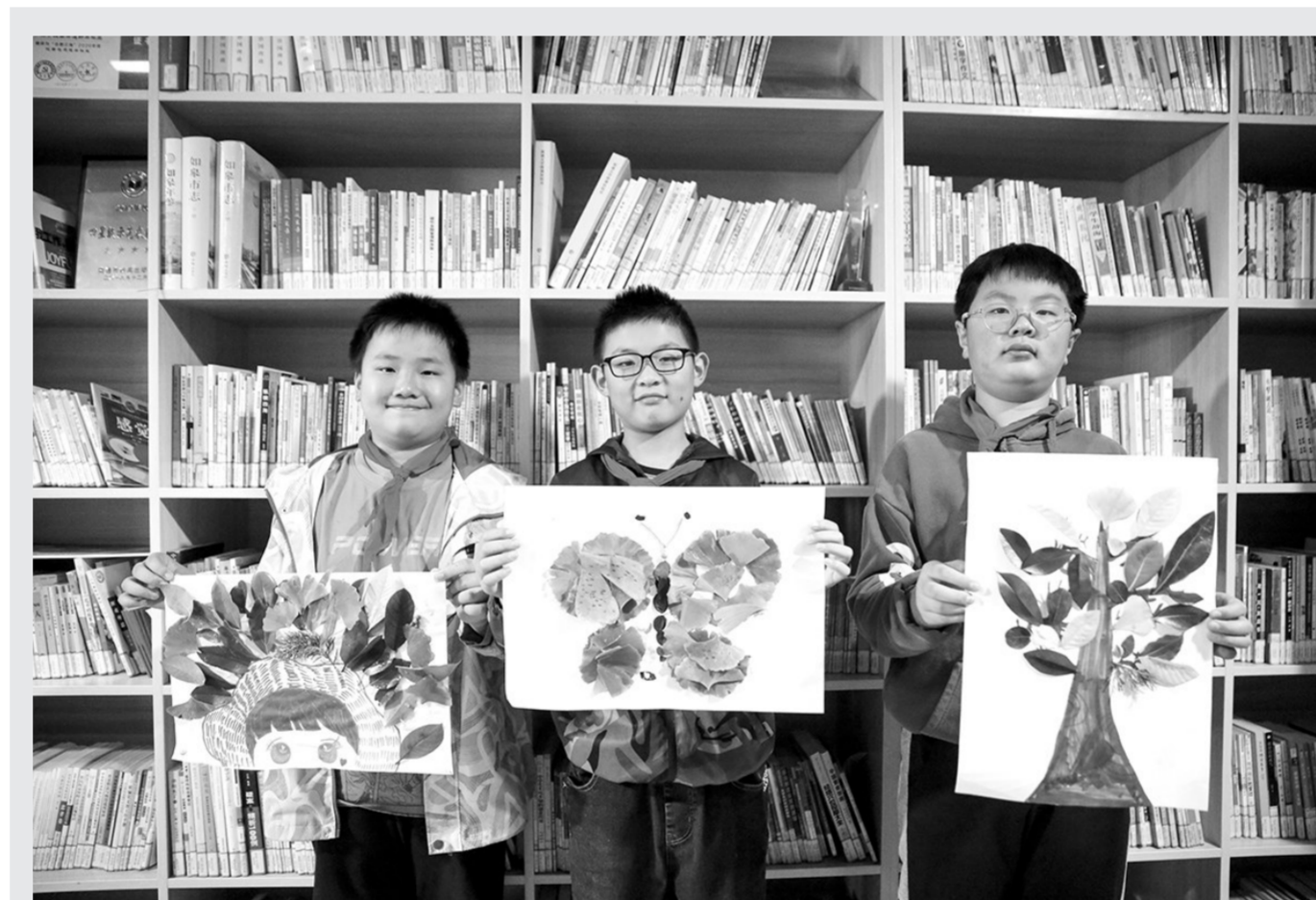
“阅”在深秋 树叶作“画”

活动现场,注艺集团制作的“鹏城故事”系列、“大写的深圳人”系列、“海峡两岸”系列等多部微短剧揭晓。注艺集团还响应国家广播电视总局“跟着微短剧去旅行”号召,在全国范围内建立起深圳丰隆、深圳南澳、佛山大旗头、咸阳袁家村、郴州莽山等多个实景拍摄基地,灵活运用微短剧创作手段,促进各地“微短剧+文旅”的融合。