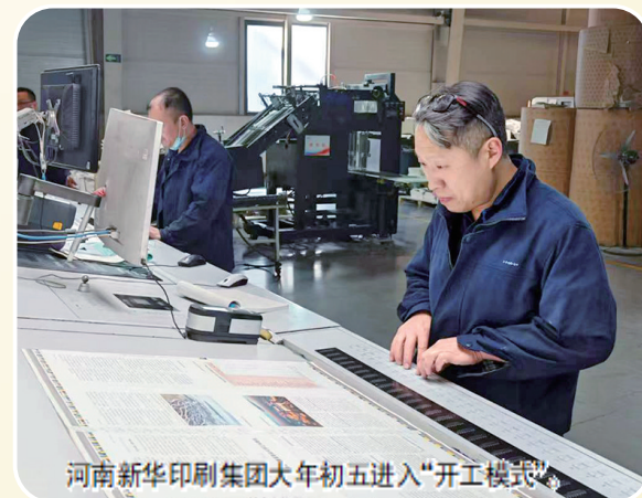
河南新华印刷集团大年初五进入“开工模式”。