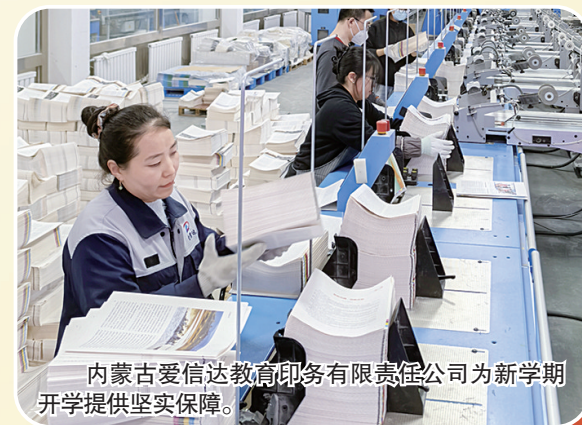
内蒙古爱信达教育印务有限责任公司为新学期开学提供坚实保障。