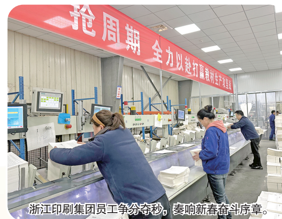
浙江印刷集团员工争分夺秒,奏响新春奋斗序章。