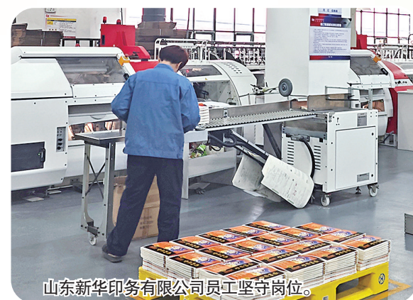
山东新华印务有限公司员工坚守岗位。

上海印刷集团青浦印刷园区则在春节前圆满完成2025年春季教材印制任务,实现“开门红”。记者了解到,面对周期紧、任务重、强度大、标准高的春季教材印制任务,青浦印刷园区提产能、优质量、保安全,承印的250个品种、1611万册教材,已按时保质保量全部交付物流发运。值得一提的是,除夕前的四五天,青浦印刷园区党委还组织开展“义务劳动表率、快乐奉献风采”活动,200多人次的党员、积极分子、科室人员踊跃参与,协助装订车间完成部分教材和图书配套,为春季教材印制贡献力量。