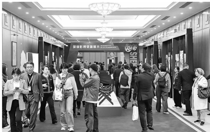
首届中国电视剧制作产业大会吸引了众多业界人士参与。