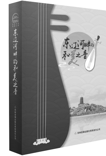
《东辽河畔的和美之音》 吉林音像出版社