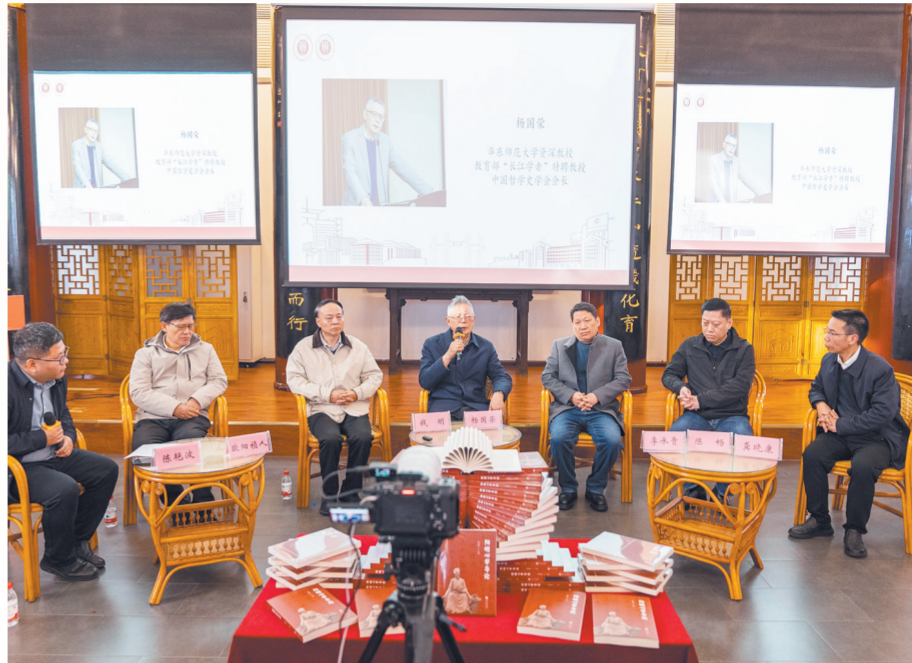
与会嘉宾分享阅读心得。

与会专家学者围绕《阳明心学导论》的学术价值、阳明心学的思想内涵及其在当代教育、文化传承与社会实践中的意义展开了深入研讨,一致认为该书的出版为传统文化当代传播提供了优质范本。